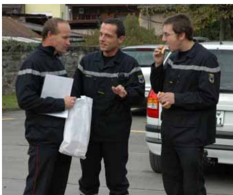
Dernières mise au point pour les examinateurs...

Le diplôme « Flamme 3 » équivaut au cours FBO1 (formation de base des sapeurs-pompier). Le titulaire de cette distinction peut donc être incorporé en cours d'année dans un SDIS pour autant qu'il soit âgé de 18 ans révolus et que le règlement communal le prévoit. Selon le GVJSP en 2005, 18 jeunes ont passé leur flamme 3 et 35 s'étaient inscrits pour 2006 !