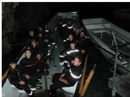
Un petit tour en barque !