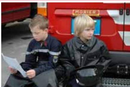
Arrivée des candidats plus ou moins décontractés...